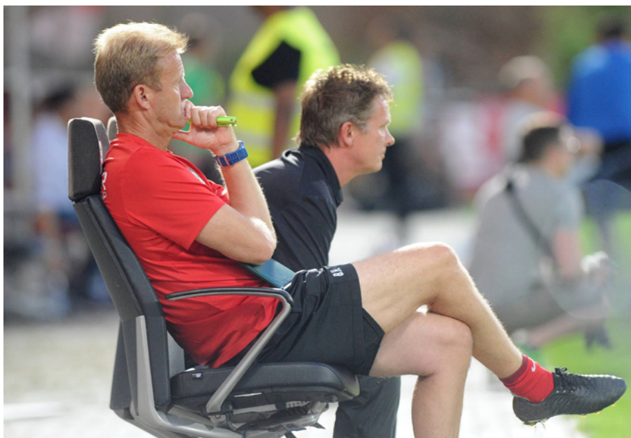
In Situation 1 geht es darum, wo innerhalb der Coaching-Zone die Trainerbank stehen darf.

Für den aktuellen Regel-Test hat DFB-Lehrwart Lutz Wagner Fragen zusammengestellt, die von Fußball-Trainern an ihn herangetragen wurden.