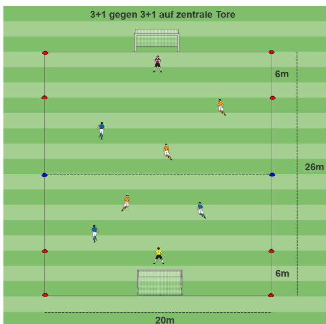
Abbildung 1: Spielfeldaufbau