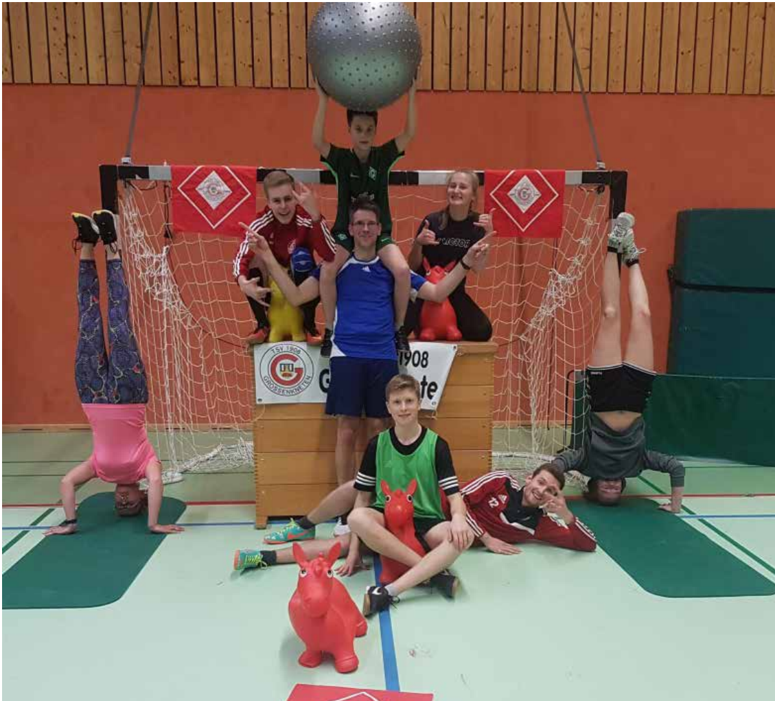
Vereinscup - Siegerfoto