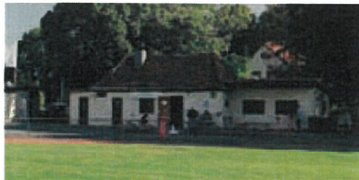
Auf den Fotos das alte Vereinsgebäude (sog. Umkleidetrakt, diese Fläche wurde an die Gemeinde abgegeben) und der Bauplatz, wo anschließend das neue Vereinsgebäude entstanden ist.