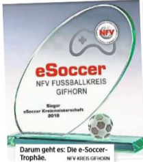
Darum geht es: Die eSoccer-Trophäe. NFV-KREIS GIFHORN

Controllern mitbringen und in Vereinskleidung spielen.“ Dann kann es auf dem virtuellen Rasen rund gehen – und zwar mit Publikums, das bei der Niedersachsenmeisterschaft in Barsinghausen aus Platzgründen noch ausgeschlossen war. „Wir freuen uns auf Vereinsvertreter und Interessierte“, unterstreicht Bärensprung. Das Turnier wird derweil an vier Bildschirmen parallel gespielt, „einer davon wird immer live auf eine Großbild-Leinwand übertragen“, so Bärensprung. „Und die Freitags-Bundesliga-Partie zwischen Mainz und Leverkusen übertragen wir auch noch.“ Bärensprung betont indes noch einmal in Richtung der Teilnehmer: „Jeder muss seinen