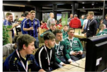
Die erste niedersachsenweite e-Soccer-Kreismeisterschaft fand in Isenbüttel statt. Das Interesse war groß.

Der NFV-Kreis hatte niedersachsenweit die erste Kreismeisterschaft im eSoccer ausgeschrieben, und 24 Teams à zwei Spieler kämpften bei Roth um den ersten Kreismeistertitel. Vorgabe des NFV war ein Spielrass bei einem Verein und die Vereinszugehörigkeit zu einem NFV-Verein. Und so saßen durchtrainierte junge Männer im Alter