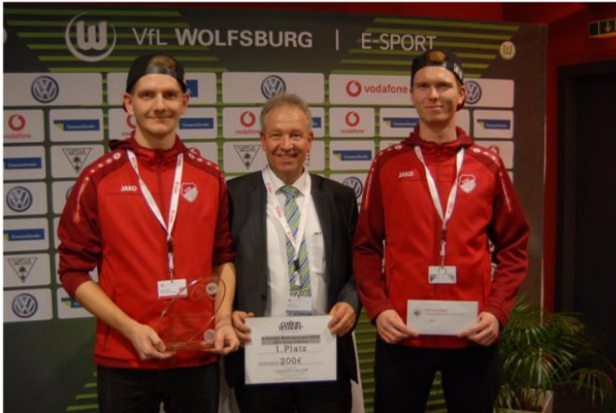
Der VfR Wilsche-Neubokel gewann das Turnier.