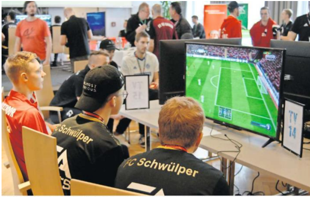
Premiere: Die Niedersachsenmeisterschaft gab's schon, jetzt folgen in Gifhorn erstmals eSoccer-Kreis-Titelkämpfe.