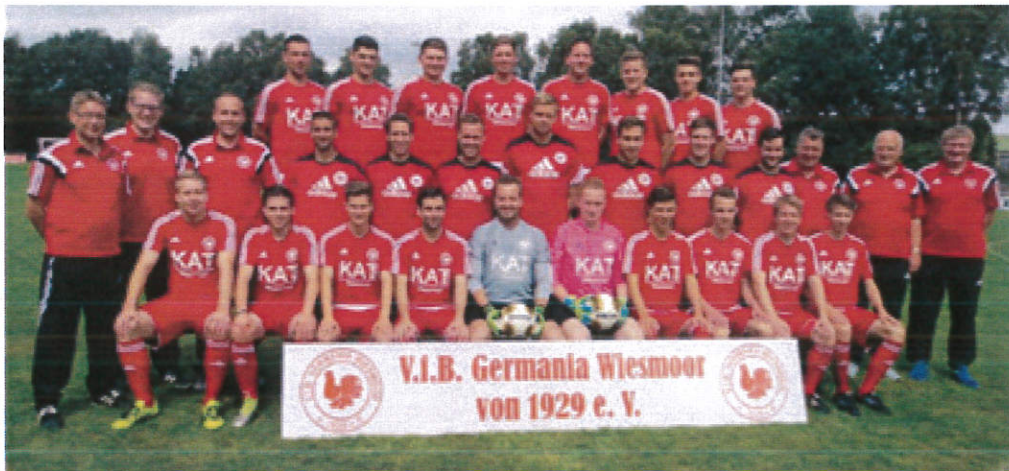
Das Mannschaftsfoto der 1. Herren des VFB Germania Wiesmoor