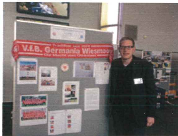
Der VFB Germania Wiesmoor, vertreten beim Markt der Möglichkeiten

Hierzu kam der NDR sogar extra für einen Videodreh in der Kabine beim VFB Germania Wiesmoor vorbei.