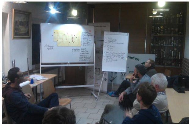
Foto- dokumentation der Zukunftswerkstatt